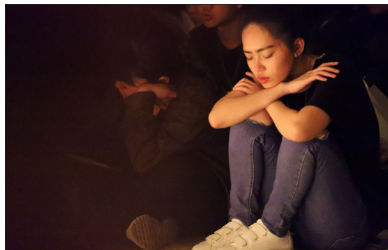
我試圖感受這一直以來的「真福氣場」，漸漸感受到，它是一個理念、一個精神、一種氛圍、一股默契、一個價值。