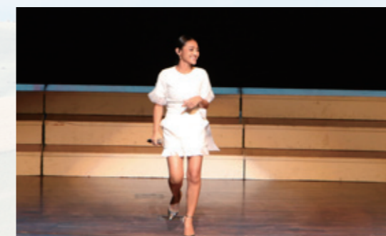
藝人葉璋庭溫暖獻唱