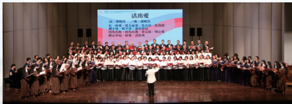
紀念單國璽樞機主教逝世五週年，活出愛音樂會在高雄文化中心盛大舉行