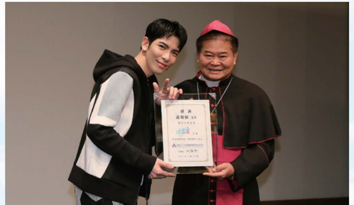
天主教單國璽社福基金會 劉振忠總主教 頒發感謝狀給活出愛大使 蕭敬騰

身體行動不便，但仍帶著開朗的笑容。節目中紀錄了偉誠在師長的鼓勵下參加三鐵比賽，雖然訓練過程相當辛苦，但偉誠表示，「希望能為和我一樣不能跑的孩子而跑。」他堅毅的精神，讓蕭敬騰感到相當敬佩，並給予自己的小粉絲大大的擁抱。