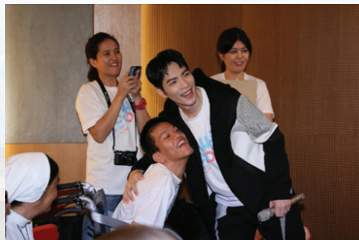
活出愛大使 蕭敬騰 以擁抱鼓勵 腦性麻痺勇敢少年偉誠