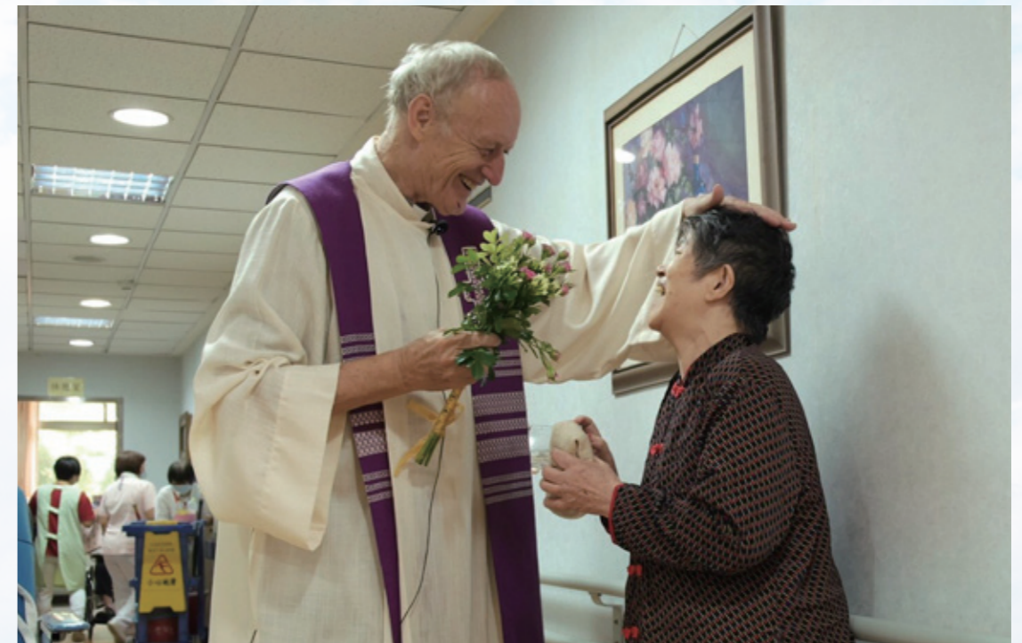
期望發揮愛主愛人的精神，關懷長者

我們將在據點開辦「日托服務」，只要經評估為輕度以上的失能及失智長者，本會將提供生活照顧、認知促進、簡易復健、娛樂活動及靈性關懷，創造友善的環境；以及每週皆會辦理「共餐服務」，使長者不為下一餐在哪而煩惱，促進他們的人際互動、鼓勵走出家門、攝取足夠營養，讓生活不是在幾坪不到的空間裡，而是延伸到社區的每個角落。