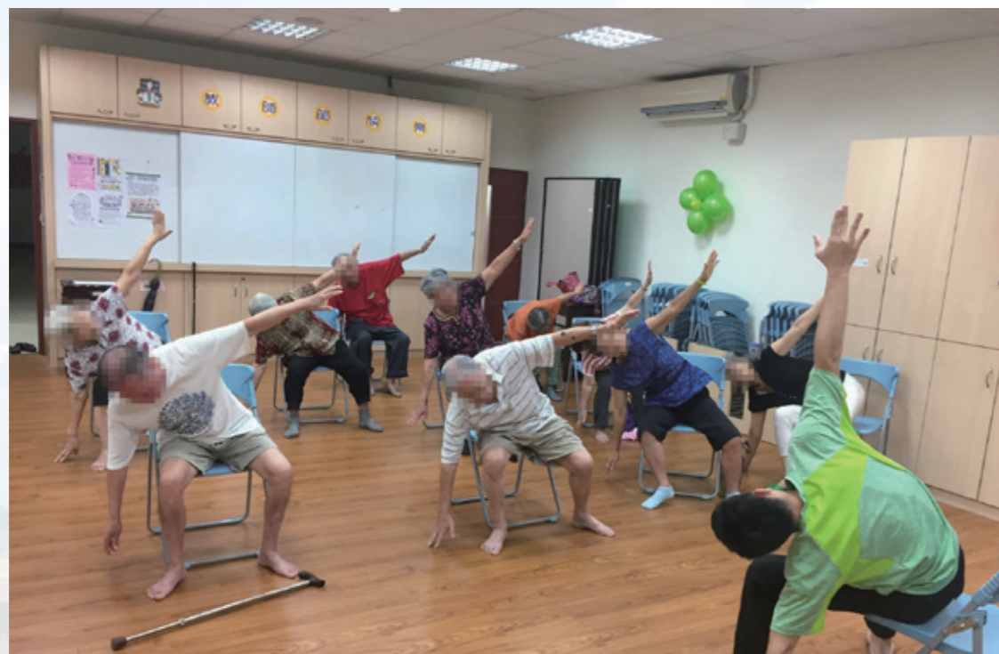
本會將辦理「健康促進活動及課程」，豐富社區照護資源(轉載自天主教失智老人基金會)

依據世界衛生組織統計結果，全球失智人口已將近五千萬人，並從每四秒增加一人提高到每三秒多一人，代表失智症問題將愈來愈嚴重，而目前專家學者推估，去年全台失智症人口已超過26萬。未來50年全台更可能突破85萬人，代表每個人都有機會成為失智症的候選人。