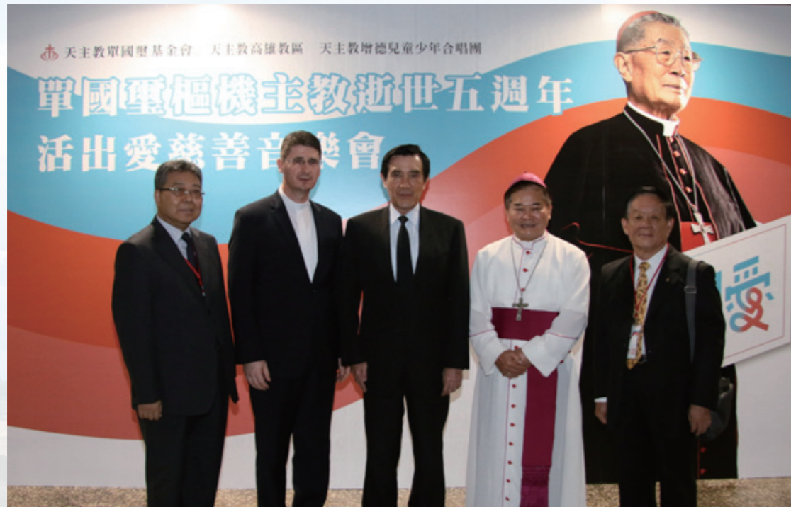
(由左至右)鄧世雄執行長、教廷代辦高德隆蒙席、馬英九前總統、劉振忠總主教、胡僑榮董事合影

前總統馬英九、教廷駐華大使館代辦高德隆蒙席專程南下與會，並全程聆賞，佛光山副住持釋慧昭法師、靈鷲山釋法泰法師、榮休教廷大使葉勝男總主教、台南教區林吉男主教、監察委員江綺雯、高雄市副市長許銘春、副秘書長蔡柏英、民政局副局長陳淑芬、立法委員管碧玲、市議員張豐藤、黃柏霖、吳益政、神父、修女和來自全台各地的貴賓，幾乎坐滿至德堂1700個座位。