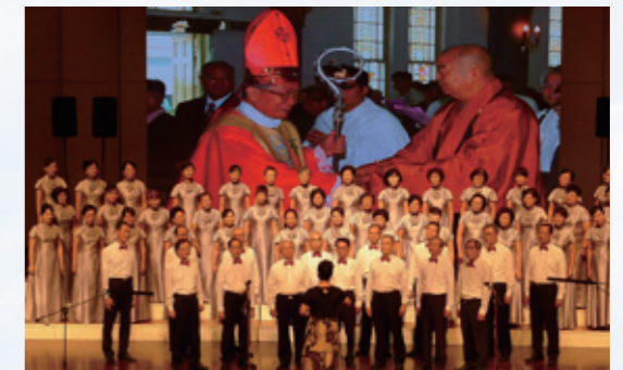
佛光山南屏合唱團傳揚活出愛的真諦