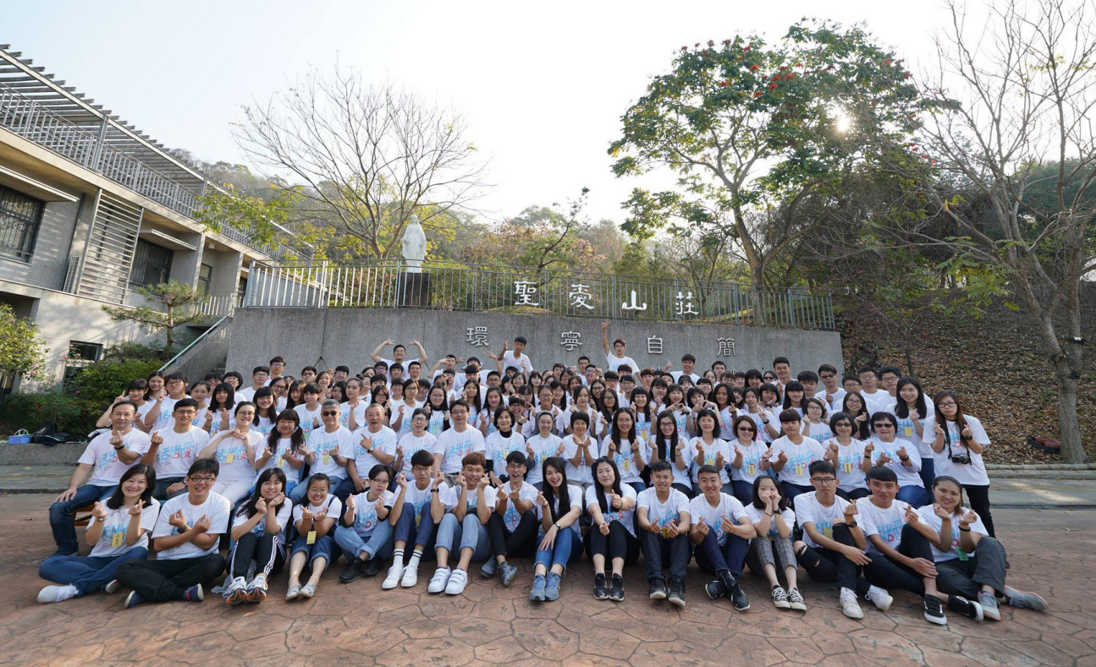
2019 年在台中聖愛山莊辦理生命探索營