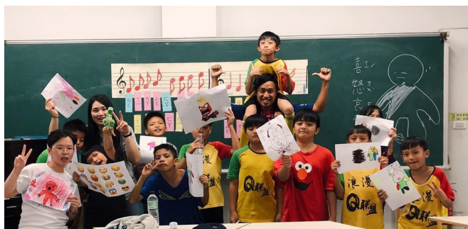
真福青年苑庭（左三）運用心理專長至花蓮秀林陪伴孩童

為了延續樞機活出愛精神，本會於 2017 年起製作「活出愛節目」希望透過影像的傳播力將各地愛的故事傳遞出去，啟動善的循環，讓社會充滿愛的力量。而今年度本會完成了第九集【青年不在家】，影片中參與者與陪伴者的分享幫助我們明瞭，促使這群青年願意善用課後時光遠至花蓮秀林鄉陪伴孩童的驅動力和精神是什麼？