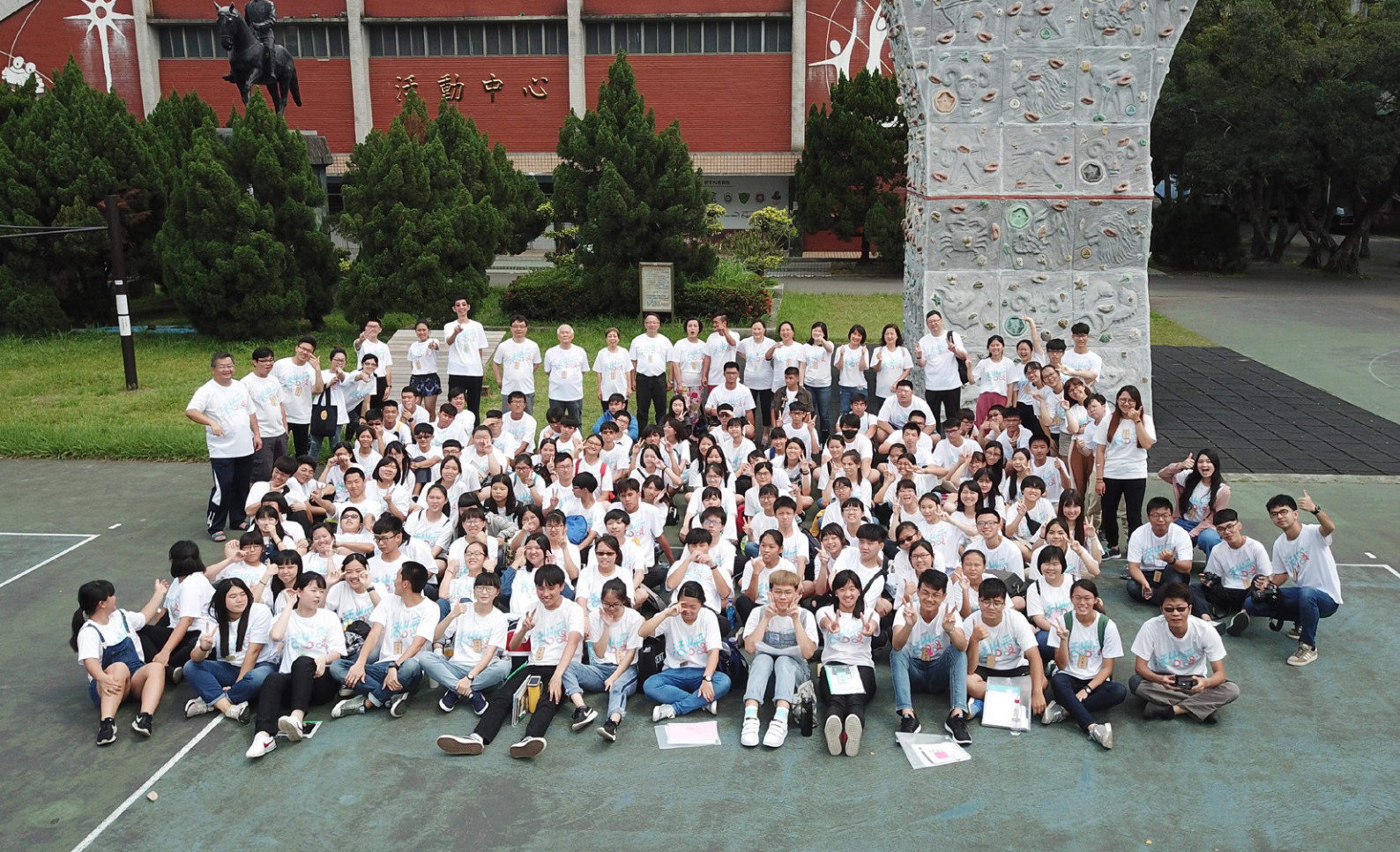
2019 年在新北市恆毅中學辦理生命探索營