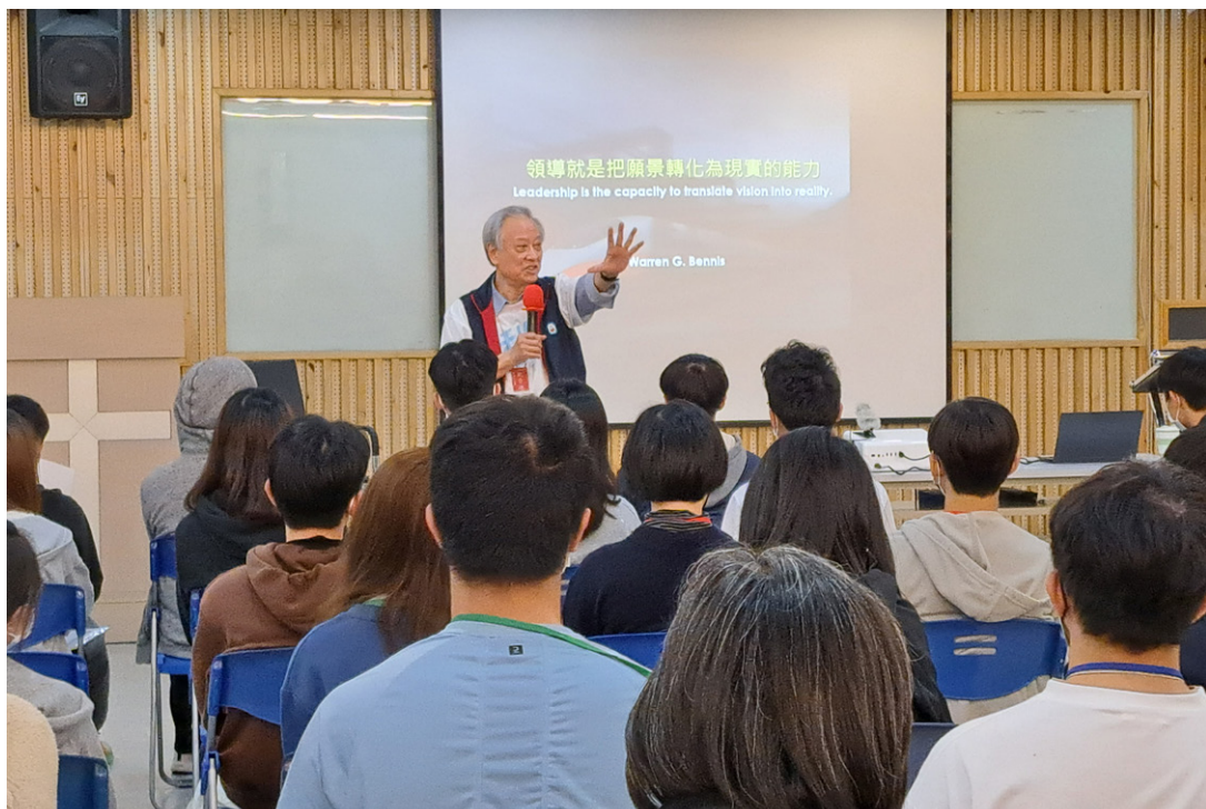
歐普德主講領袖特質

對於第二次回營的青年，設計了小真福工作坊，一方面學習協助營隊的運作，一方面更加的認識單樞機，立志成為活出愛的勇兵，期許成為真福青年。2015、2016、2017 這三年的營隊，一年比一年更加熱絡，生命探索營影響著一批又一批的青年。